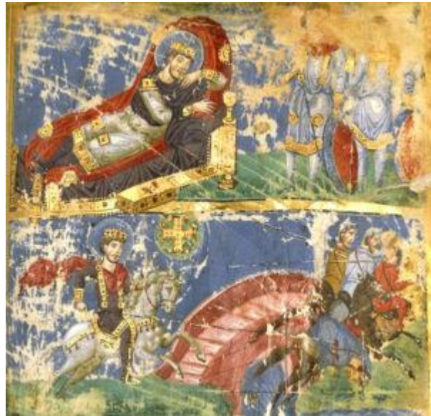
Arriba: Sueño de Constantino antes de la batalla del Puente Milvio . In hoc signo vinces (Con este signo vencerás).

Aunque hay algunos ejemplos de utilización previa, el concepto de Edad Media nació como la segunda edad de la división tradicional del tiempo histórico debida a Cristóbal Cellarius ( Historia Medii Aevi a temporibus Constantini Magni ad Constantinopolim a Turcis captam deducta (Jena, 1688), quien la consideraba un tiempo intermedio, sin apenas valor por sí mismo, entre la Edad Antigua identificada con el arte y la cultura de la civilización grecorromana de la Antigüedad clásica y la renovación cultural de la Edad Moderna -en la que él se sitúa- que comienza con el Renacimiento y el Humanismo.