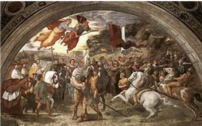
Encuentro de León Magno con Atila , fresco de Rafael Sanzio en las estancias del Vaticano (1514).

Los abusos románticos de la ambientación medieval (exotismo), produjeron ya a mediados del siglo XIX la reacción del realismo. Otro tipo de abusos son los que dan lugar a una abundante literatura pseudohistórica que llega hasta el presente, y que ha encontrado la fórmula del éxito mediático entremezclando temas esotéricos sacados de partes más o menos oscuras de la Edad Media (Archivo