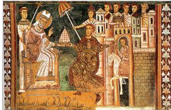
El papa Silvestre I bendice a Constantino , del que recibe con la tiara (símbolo del pontificado romano clásico, similar a otros tocados político-religiosos, como la doble corona de los faraones) el poder temporal sobre Roma. Fresco del siglo XIII, capilla de San Silvestre, monasterio de los Cuatro Santos Coronados .