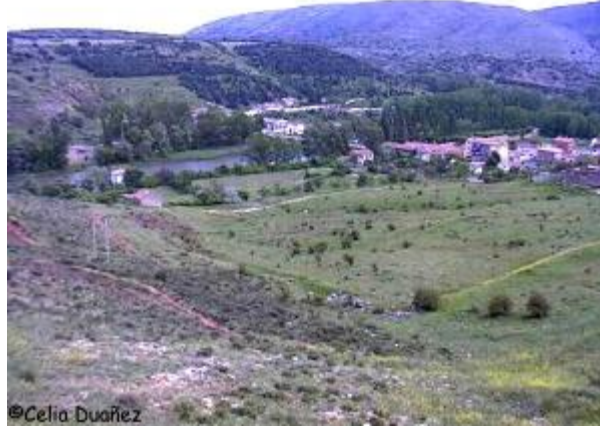
El monte de las Ánimas

perseguir como a una fiera a una mujer hermosa, pálida y desmelenada, que con los pies desnudos y sangrientos, y arrojando gritos de horror, daba vueltas alrededor de la tumba de Alonso.