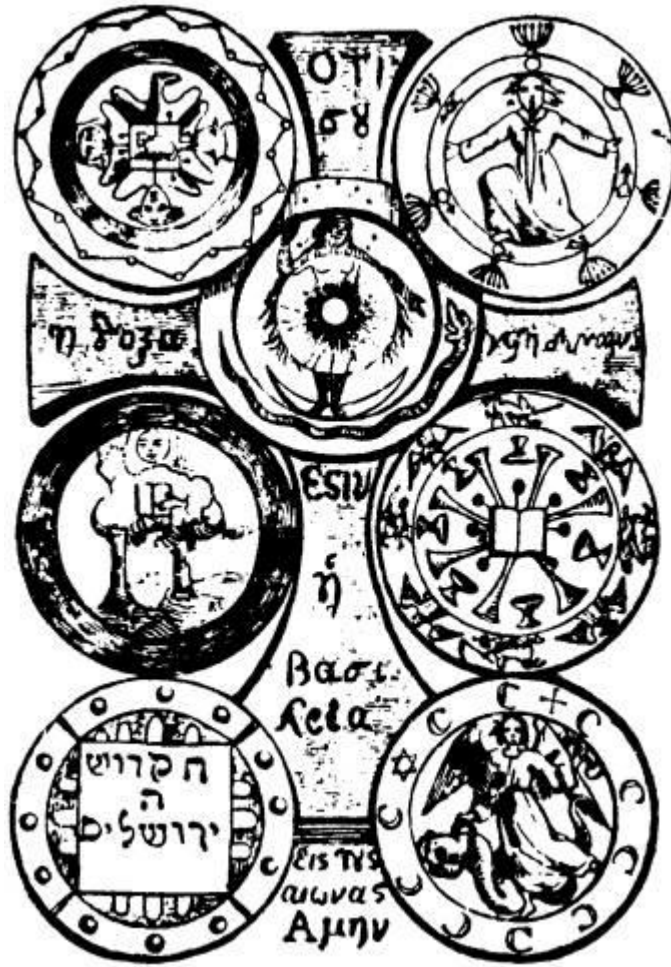
PENTACULO DE SAN JUAN

Contra toda clase de hechizos y encantamientos se dibuja sobre pergamino virgen, empleando la tinta celeste, y se sahüma con los perfumes del Sol.