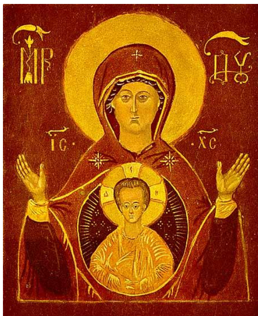
Icono de los dositeos

Es posible que en la actualidad los mandeos no se hallen confinados exclusivamente a Iraq o Irán (esto es, si han conseguido sobrevivir a los desmanes de Saddam), ya que podrían hallarse representados por otra secta muy encerrada en sí misma que todavía existe en la Siria moderna. Son los nusairiyeh o nusayrís (a veces llamados también alawíes por el nombre de las montañas en que viven).