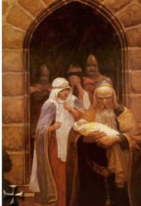
Miembros del Priorato de Sion y Los descendientes Merovingios

Recordemos la tradición «juanista» de algunas formas de la francmasonería oculta europea y del Priorato de Sión, 18 según la cual los caballeros templarios habían adoptado la religión de «los juanistas de Oriente» formada por las enseñanzas secretas que Jesús entregó a Juan, su discípulo amado. Una vez tengamos claro que el Evangelio de Juan era material originariamente del Bautista, queda despejada la confusión aparente entre Juan el discípulo predilecto y Juan el Bautista que hemos observado varias veces.