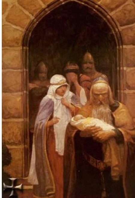
Miembros del Priorato de Sion y Los descendientes Merovingios

Recordemos la tradición «juanista» de algunas formas de la francmasonería oculta europea y del Priorato de Sión, 18 según la cual los caballeros templarios habían adoptado la religión de «los juanistas de Oriente» formada por las enseñanzas secretas que Jesús entregó a Juan, su discípulo amado. Una vez tengamos claro que el Evangelio de Juan era material originariamente del Bautista, queda despejada la confusión aparente entre Juan el discípulo predilecto y Juan el Bautista que hemos observado varias veces.