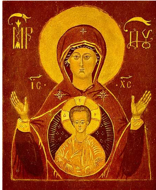
Icono de los dositeos

Es posible que en la actualidad los mandeos no se hallen confinados exclusivamente a Iraq o Irán (esto es, si han conseguido sobrevivir a los desmanes de Saddam), ya que podrían hallarse representados por otra secta muy encerrada en sí misma que todavía existe en la Siria moderna. Son los nusairiyeh o nusayrís (a veces llamados también alawíes por el nombre de las montañas en que viven).